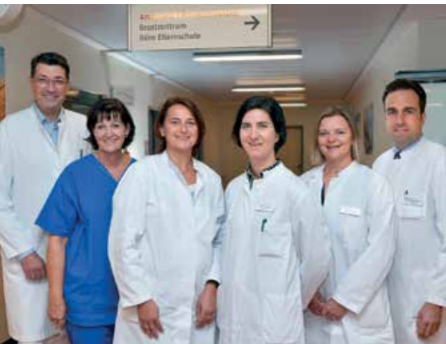
Wir sind für Sie da: das Team des zertifizierten Brustzentrums.