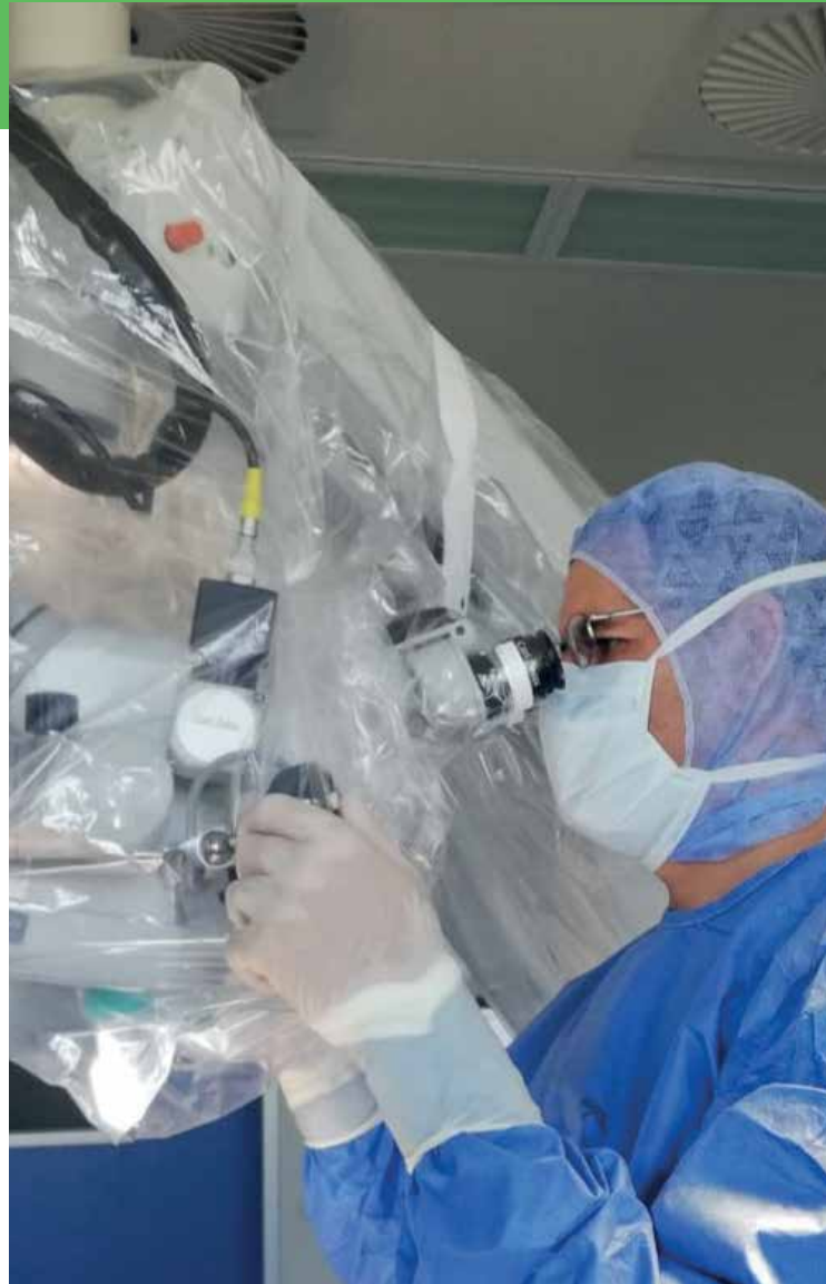
Die Operationen werden hauptsächlich unter Sicht mittels OP-Mikroskop in minimal-invasiver Technik durchgeführt.

Sektionsleiter der Wirbelsäulenchirurgie