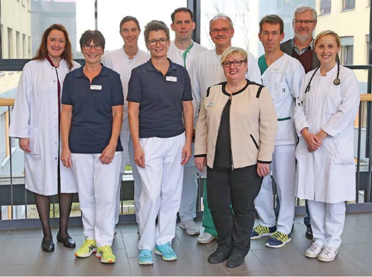
Das Team der Palliativstation