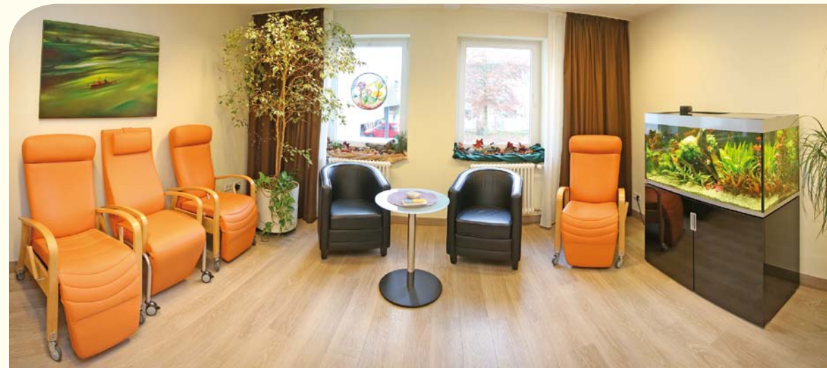
Raum der Stille