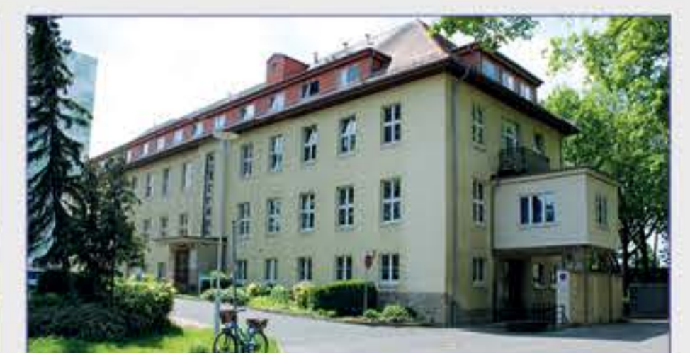
Haus 27 - Betriebsarzt, Einkauf