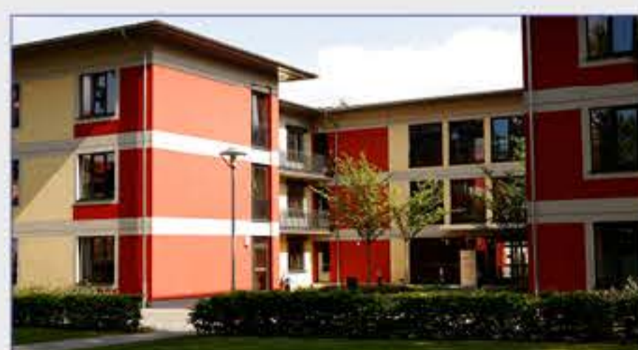
Haus 15 - Psychiatrie, Psychotherapie und Psychosomatik