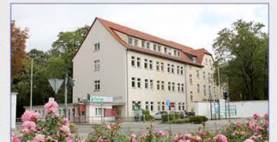
Haus 11 - Hauptpforte und Verwaltung / Klinikgeschäftsführung