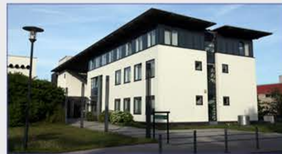
Haus 4 - Strahlenklinik