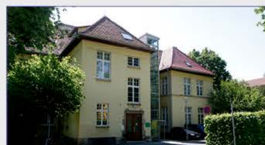
Haus 19 - Sozialpädiatrisches Zentrum