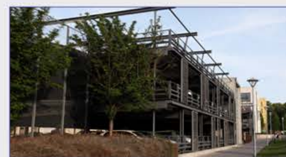
Haus 66 - Parkhaus Zufahrt über die Marie-Elise-Kayser-Straße