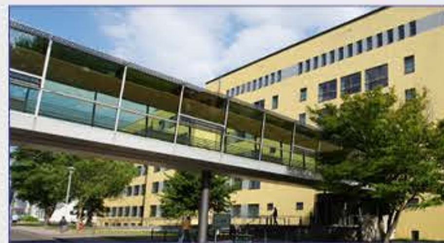
Haus 2 - Gebäude für Innere Medizin und Hautkrankheiten mit Auditorium (EG)