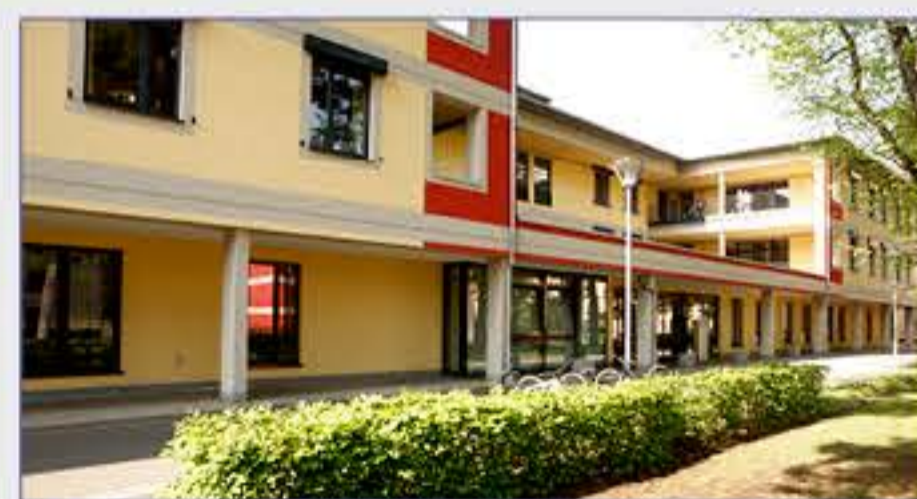
Haus 13 - Zentrum für Geriatrie