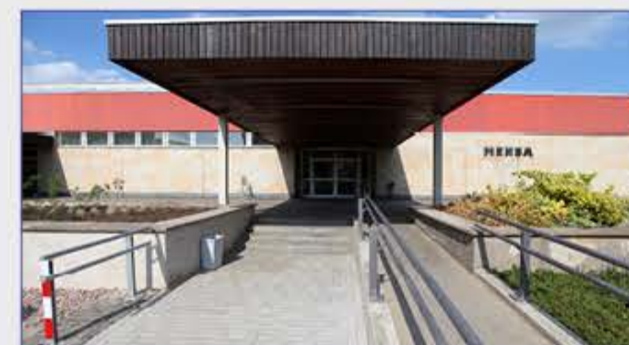
Haus 5 - Mensa/Impfstelle der Kassenärztlichen Vereinigung Thüringen