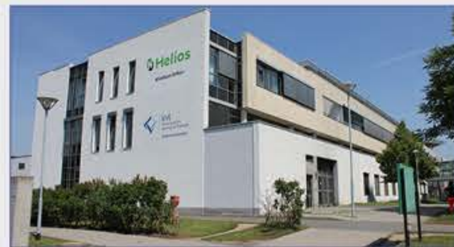
Haus 1 - Hauptgebäude mit Haupteingang - Rezeption/Aufnahme - Cafeteria - Geldautomat - Einkaufsmöglichkeit