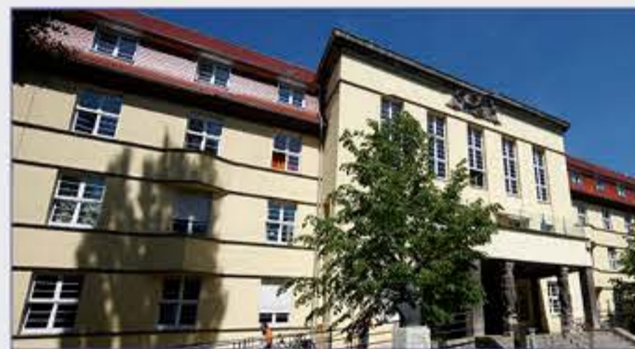
Haus 3 - Frau-Mutter-Kindzentrum