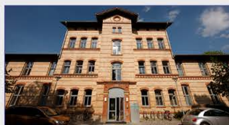
Haus 14 - Kinder- und Jugendpsychiatrie, Psychotherapie und Psychosomatik