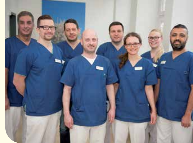
Das Team der Urologie