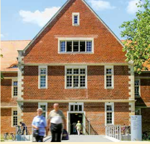
Poliklinik Haus 210