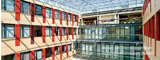
Atrium der Interdisziplinären viszeralmedizinischen Station