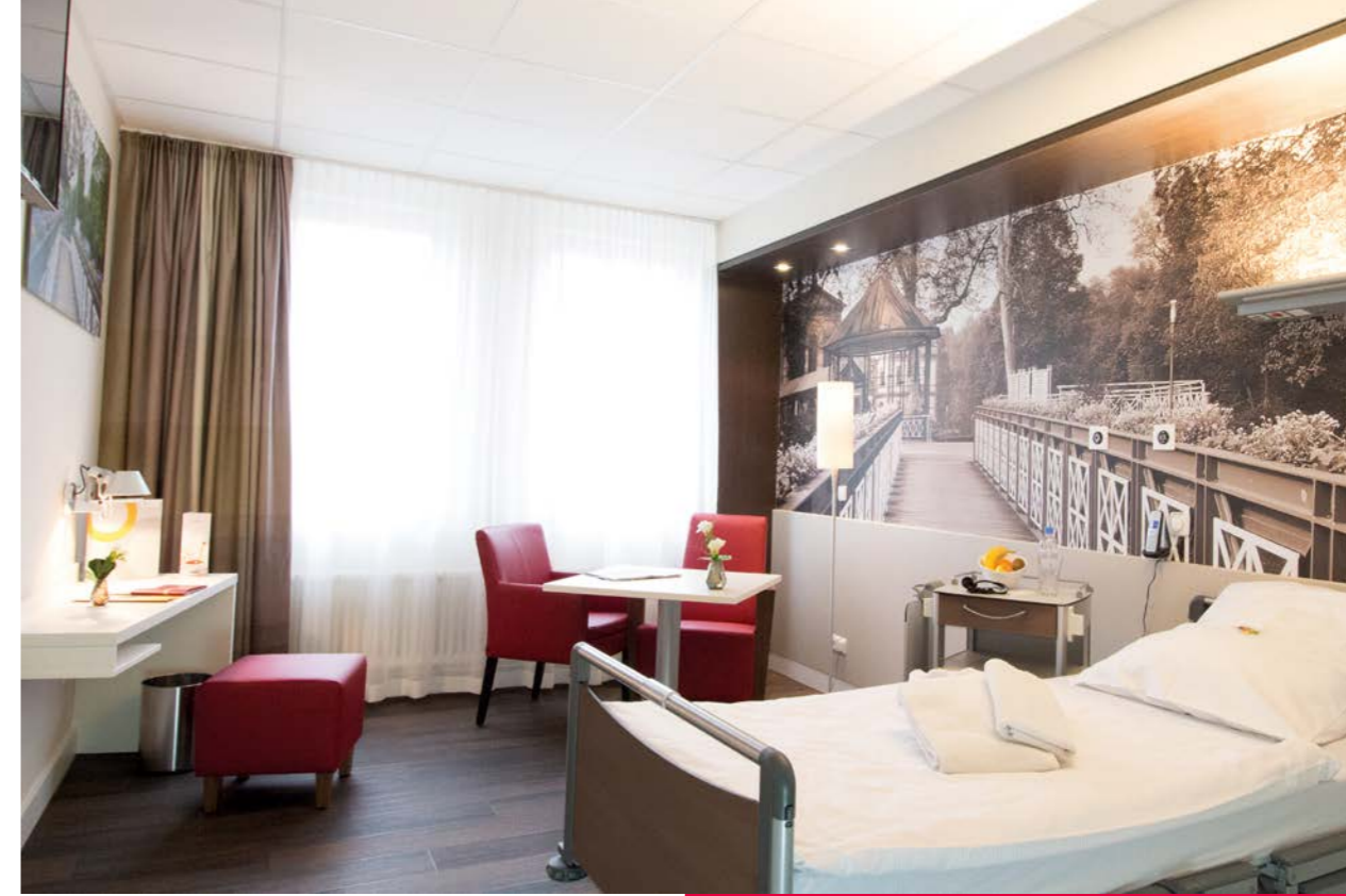
Ihre Unterkunft in unseren Privatkliniken