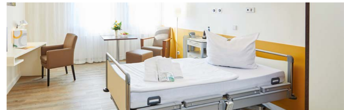
Ihre Unterkunft in unseren Wahlleistungsbereichen

Sprechen Sie uns gerne an – unsere Wahlleistungsmanager sind für Sie da und beantworten Ihre Fragen!