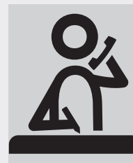
Kreißsaal (07631) 88-3936