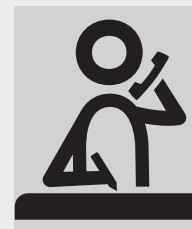
Kreißsaal (07631) 88-3936