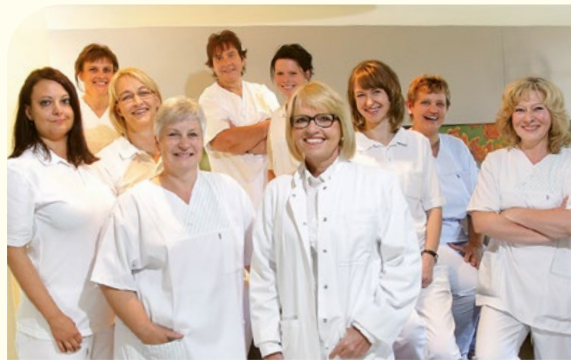
Das Geburtshilfeteam der Klinik Köthen.