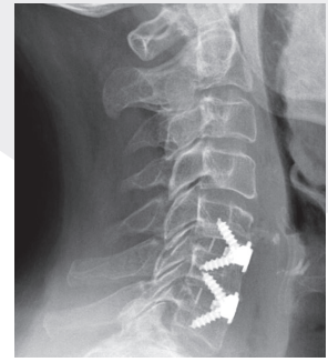
Dekompression des Rückenmarkkanals mit Achsenkorrektur der Halswirbelsäule