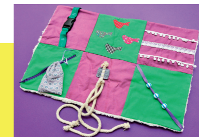
Eine Demenz-Nestel-decke zu Beschäftigung und Beruhigung von Demenz-Patienten