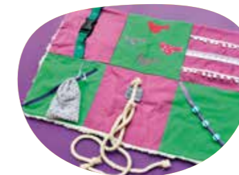
Eine Demenz-Nesteldecke zu Beschäftigung und Beruhigung von Demenz-Patienten