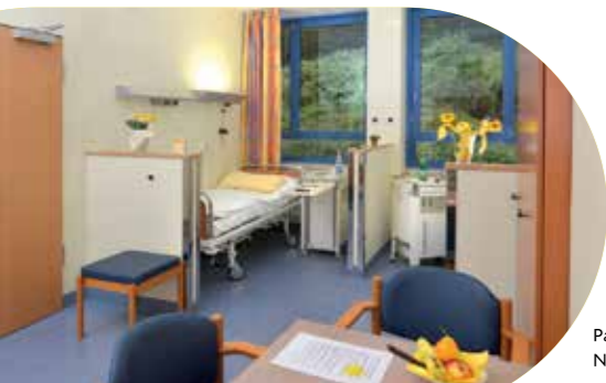
Patientenzimmer der Nuklearmedizin

Unsere 15-Betten Station besteht aus Ein- und Zweibettzimmern mit dem neuesten Standard. Die Zimmer sehen aus genau wie „gewöhnliche“ Krankenhauszimmer und sind mit jeweils einer eigenen Nasszelle und großen Fenstern ausgestattet.