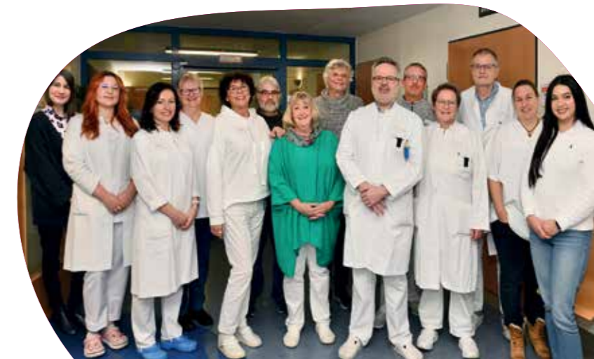
Team der Klinik für Nuklearmedizin

... ist während des stationären Aufenthaltes leider nicht gestattet, der Gesetzgeber untersagt dies aus strahlenschutzrechtlichen Gründen. Sie haben jedoch regelmäßigen Kontakt mit dem Pflegepersonal, den MTAs und den Ärzten.